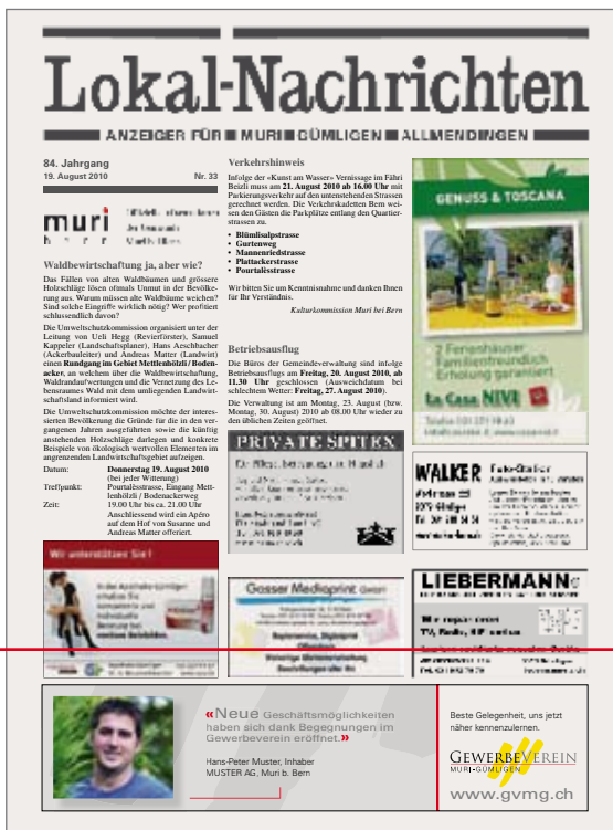
Beispiel in den Lo-Na

Besten Dank für eine aktive Zusammenarbeit.